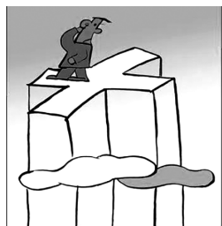
在人生的十字路口过分“犹豫”,那么“机遇”也可能变成“绝路”。

11. 全国人大常委会表决通过的《中华人民共和国粮食安全保障法》,是一部为国家粮食安全提供全面保障的专项性法律,对保障我国粮食有效供给、提高防范和抵御粮食安全风险能力、促进经济社会发展都具有重大意义。该法的制定蕴含的唯物史观道理是 ( )